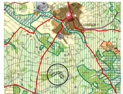
Abb.: Darstellung im Regionalplan

Der Sachliche Teilplan „Energie“ zum Regionalplan Münsterland 2 sieht für die Fläche des Aufhebungsbereiches einen Windenergiebereich vor. Die Aufhebung des Bebauungsplanes ermöglicht ein Repowering bereits bestehender Anlagen, sodass das Gebiet auch nach der Aufhebung des Bebauungsplanes für die Erzeugung von Windenergie genutzt wird und somit den Zielen und Grundsätzen des Regionalplanes (insbesondere Ziel 1.1 und 1.2, Grundsatz 3) entspricht.